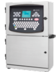
Impressora / Datador