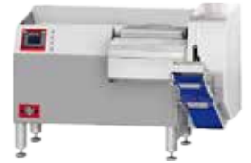
Cortadora de cubos