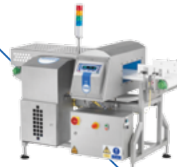
Detector de Metais / Checadora de Peso