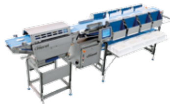
Balança Classificadora / Dinâmica