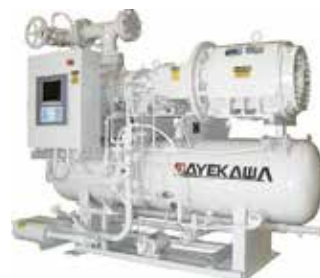
Compressor de Amônia / Ar