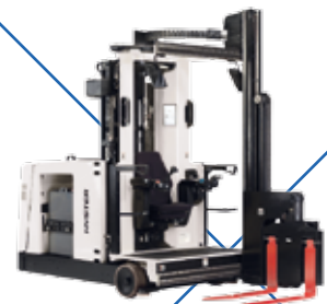
Empilhadeira / Transpaleta