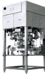
Desossadora / Toridas