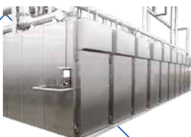
Estufa / Câmara