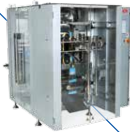
Envasadora / Sacheteira